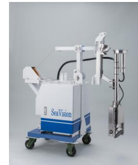
新型超音波測深装置「SV-Sonar」