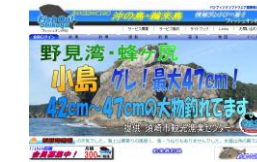
情報提供サービス事業/釣場情報サイト「フィッシュオン四国」