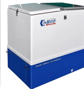
インターネット給餌システム「餌口ボ」