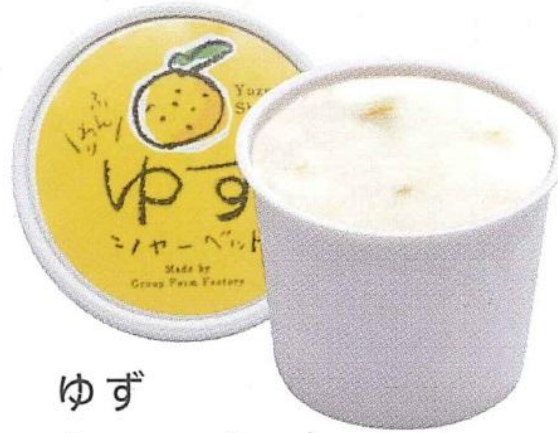
ゆず シャーベット