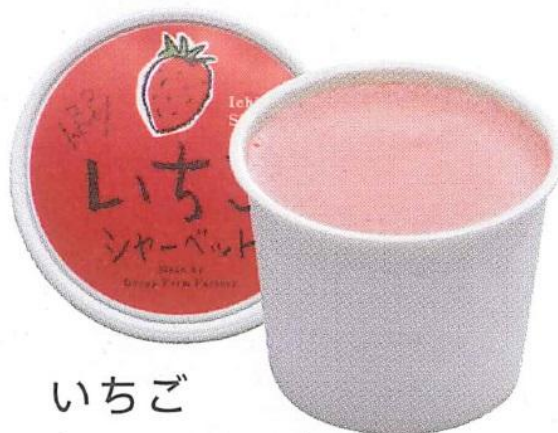
いちご シャーベット